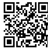
ハイキュー杯申込み