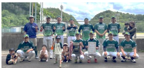
軟式野球 一般の部のみなさん